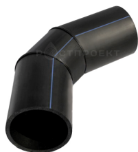
Отвод сегментный 0-45°