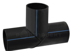
Тройник сегментный 90°