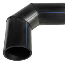
Отвод сегментный 46-90°