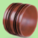
Двойной раструб или надвижная муфта