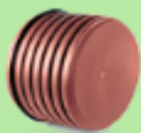
Заглушка для раструба